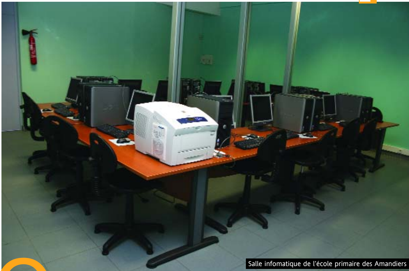
Salle informatique de l'école primaire des Amandiers