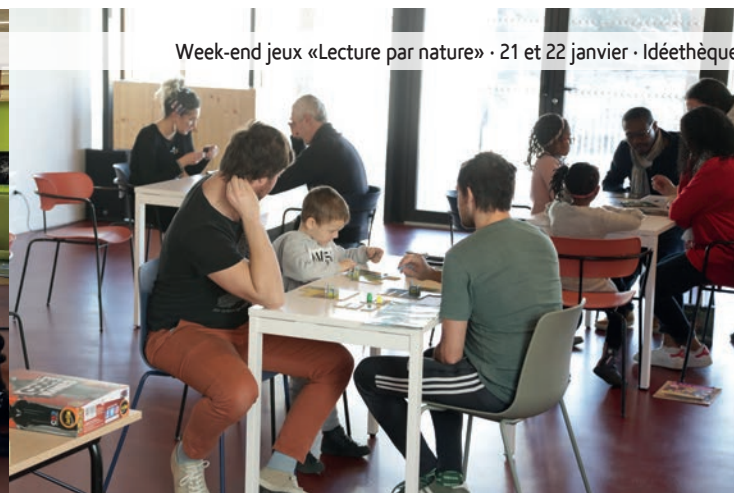
Week-end jeux «Lecture par nature» - 21 et 22 janvier - Idéethèque