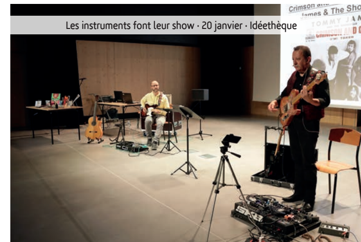
Les instruments font leur show - 20 janvier - Idéethèque