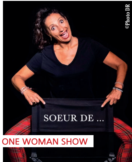
ONE WOMAN SHOW