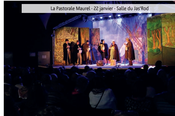
La Pastorale Maurel - 22 janvier - Salle du Jas'Rod