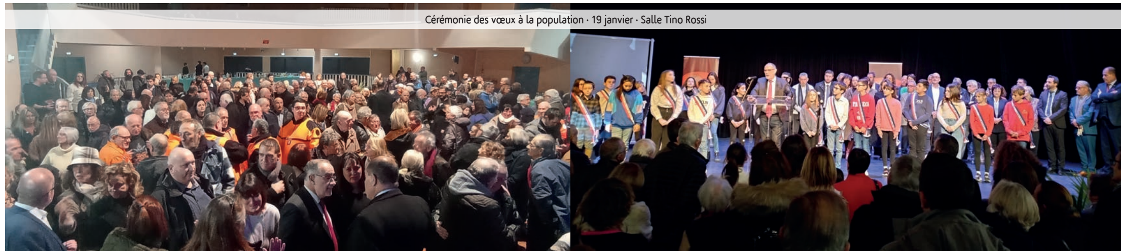
Cérémonie des vœux à la population - 19 janvier - Salle Tino Rossi