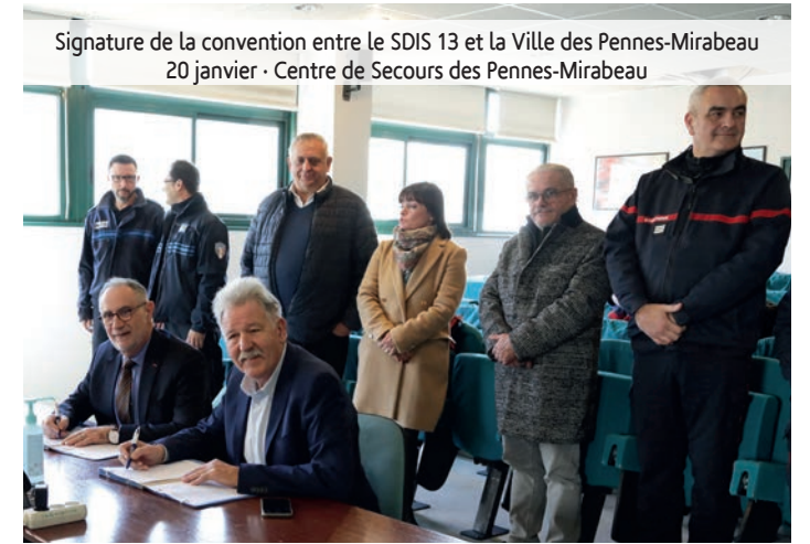
Signature de la convention entre le SDIS 13 et la Ville des Pennes-Mirabeau - 20 janvier - Centre de Secours des Pennes-Mirabeau