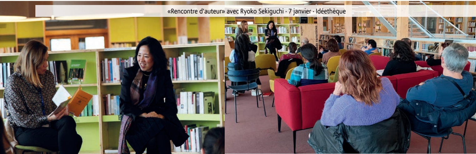
«Rencontre d'auteur» avec Ryoko Sekiguchi - 7 janvier - Idéethèque