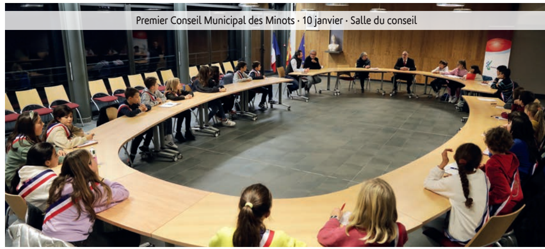
Premier Conseil Municipal des Minots - 10 janvier - Salle du conseil