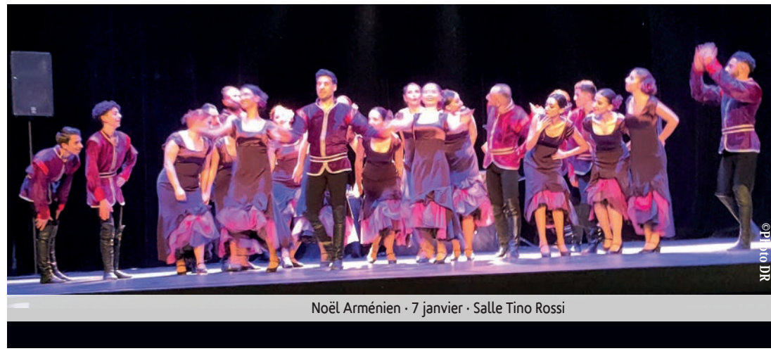
Noël Arménien - 7 janvier - Salle Tino Rossi