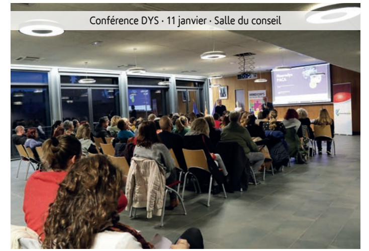
Conférence DYS - 11 janvier - Salle du conseil