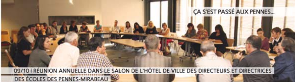
09/10 | RÉUNION ANNUELLE DANS LE SALON DE L'HÔTEL DE VILLE DES DIRECTEURS ET DIRECTRICES DES ÉCOLES DES PENNES-MIRABEAU