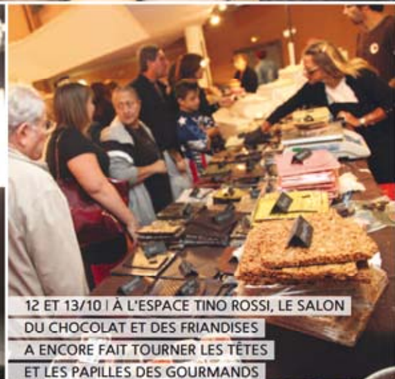
12 ET 13/10 | À L'ESPACE TINO ROSSI, LE SALON DU CHOCOLAT ET DES FRIANDISES A ENCORE FAIT TOURNER LES TÊTES ET LES PÂPILLES DES GOURMANDS