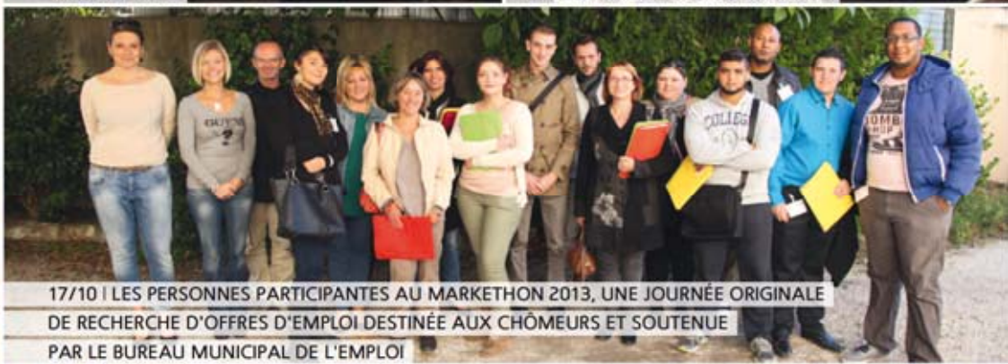
17/10 | LES PERSONNES PARTICIPANTES AU MARKETON 2013, UNE JOURNÉE ORIGINALE DE RECHERCHE D'OFFRES D'EMPLOI DESTINÉE AUX CHÔMEURS ET SOUTENUE PAR LE BUREAU MUNICIPAL DE L'EMPLOI