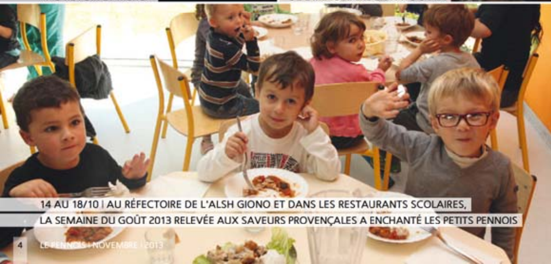
14 AU 18/10 | AU RÉFECTOIRE DE L'ALSH GIONO ET DANS LES RESTAURANTS SCOLAIRES, LA SEMAINE DU GÔÛT 2013 RELEVÉE AUX SAVEURS PROVENÇALES A ENCHANTÉ LES PETITS PENNOIS