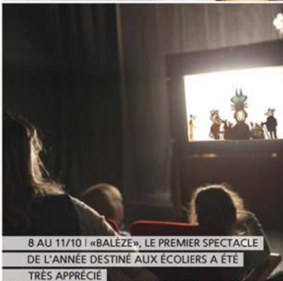
8 AU 11/10 | «BALÈZE», LE PREMIER SPECTACLE DE L'ANNÉE DESTINÉ AUX ÉCOLIERS A ÉTÉ TRÈS APPRÉCIÉ