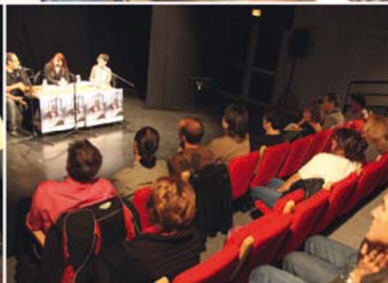
17/10 | L'ÉCRIVAIN JEAN-LUC MARCASTEL À LA CAPELANE À LA RENCONTRE DES PENNOIS DANS LE CADRE DU FESTIVAL DES LITTÉRATURES DE L'IMAGINAIRE EN PAYS D'AIX