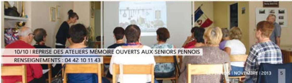
10/10 | REPRISSE DES ATELIERS MÉMOIRE OUVERTS AUX SENIORS PENNOIS RENSEIGNEMENTS : 04 42 10 11 43