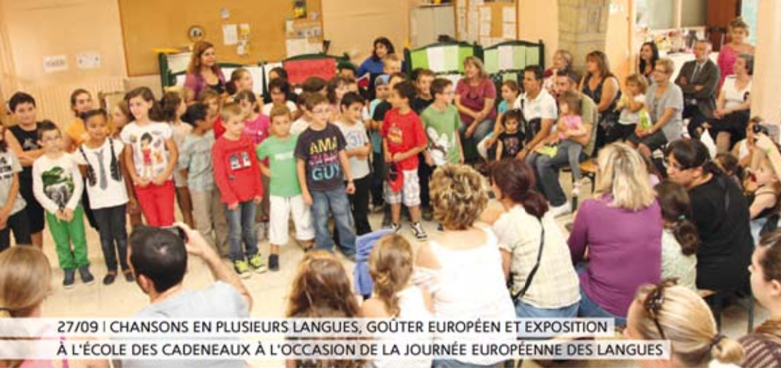
27/09 | CHANSONS EN PLUSIEURS LANGUES, GÔTER EUROPÉEN ET EXPOSITION À L'ÉCOLE DES CADENEUX À L'OCCASION DE LA JOURNÉE EUROPÉENNE DES LANGUES