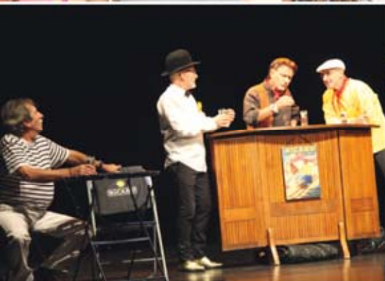
11/10 | UN TRÈS BON MOMENT DE GALÉJADES ET DE RIGOLADES AU THÉÂTRE HENRI MARTINET AVEC LES QUATRE COMÉDIENS DU SPECTACLE «AU REVOIR ET MERCI»