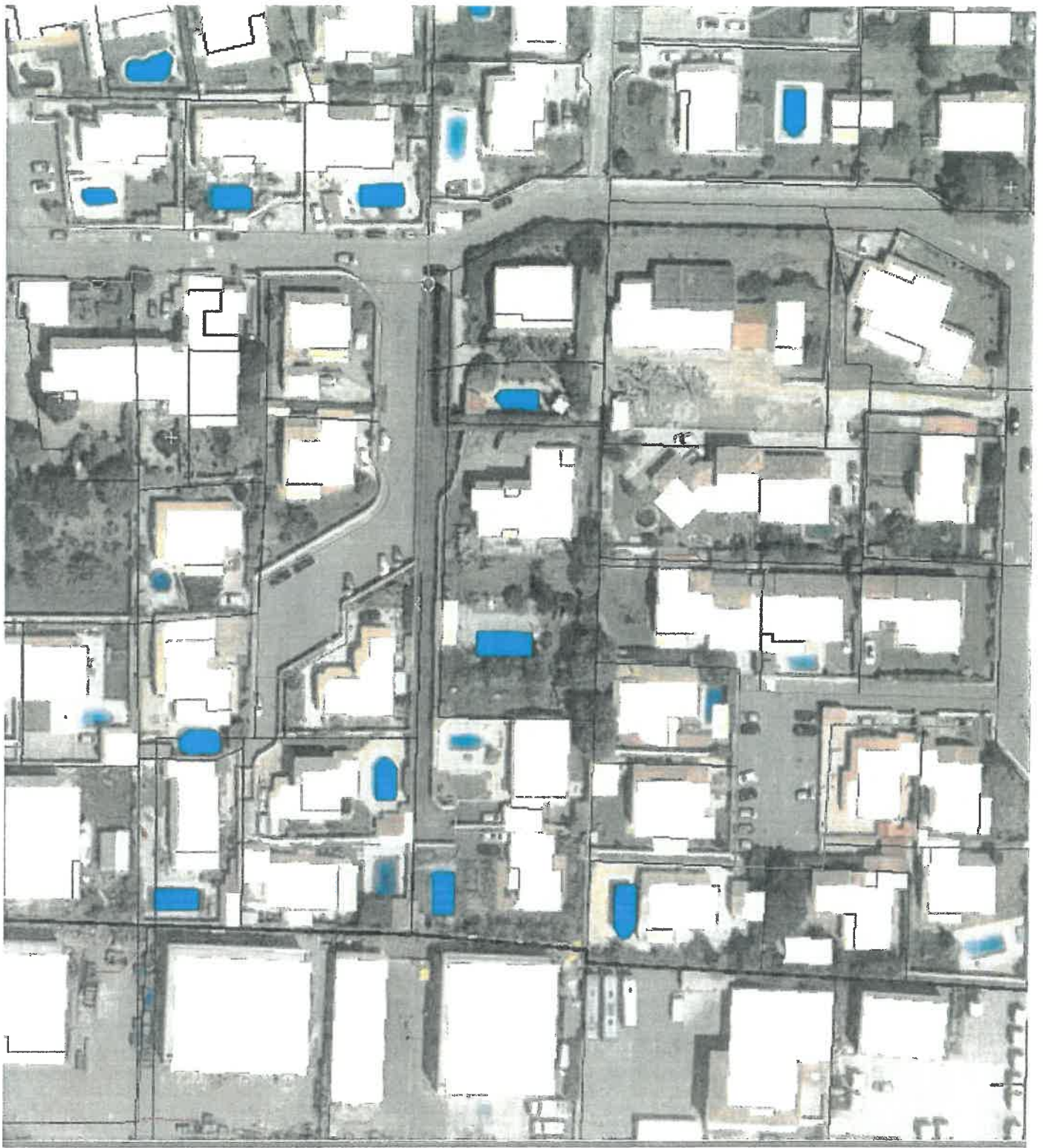
Impasse de la Cousteline